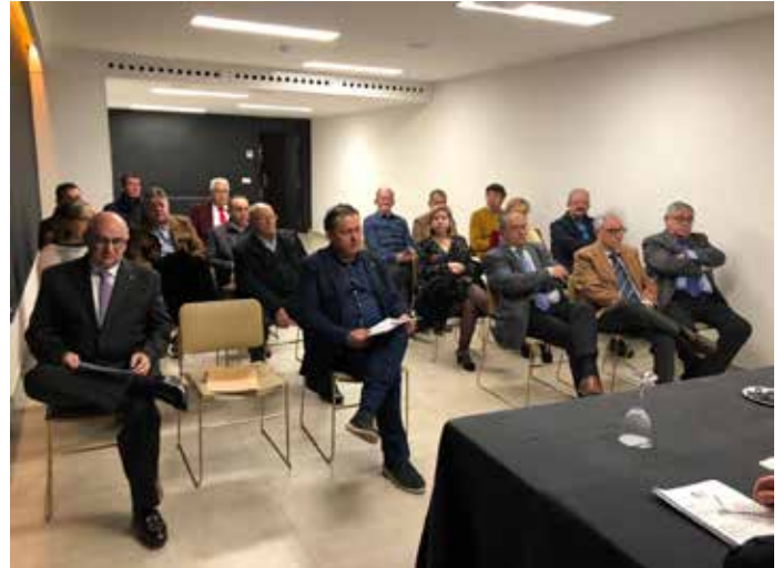
Representantes de clubs y peñas asistentes a la Asamblea General.

Como previo a la "Gala provincial de toro" que tuvo lugar el pasado 26 de enero en el hotel Intur, la Federación Taurina de Castellón celebró su Asamblea General Ordinaria, en la que los miembros de la mesa dieron cuenta de las actividades y fianzas de la Federación, así como el presupuesto para este año, que fue aprobado por unanimidad.