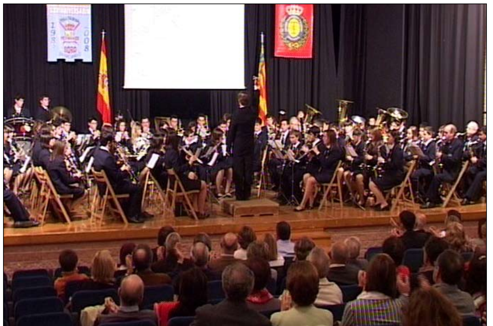
Concierto de Pasodobles Taurinos.

Como colofón a esta celebración, la noche del 8 de Noviembre, tuvo lugar en el conocido restaurante "El Cortijo", una cena de gala del XXV Aniversario con asistencia de autoridades, conferenciantes, socios y madrinas. El día siguiente, en el Auditorio Municipal, se cerraron los actos con un concierto de pasodobles taurinos interpretados por la Banda de Musica Ciudad de Benicarló, con presentación e ilustración audiovisual para cada una de las interpretaciones.