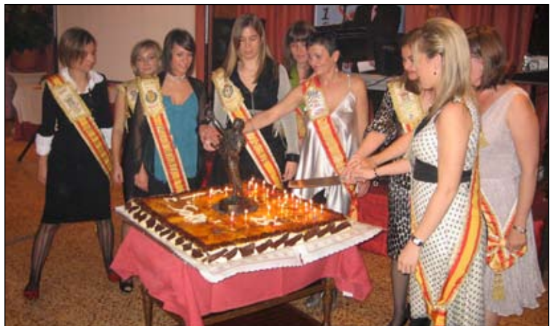
Grupo de Madrinas cortando la tarta del XXV ANIVERSARIO en la cena de gala.

RAMON MONTE SOCIEDAD DE CORREDURIA DE SEGUROS, S.L.