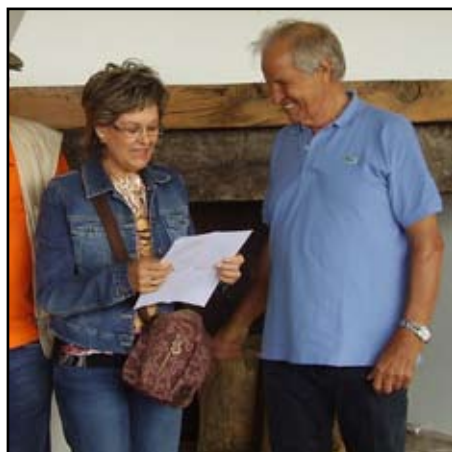
Poema al Cordobés