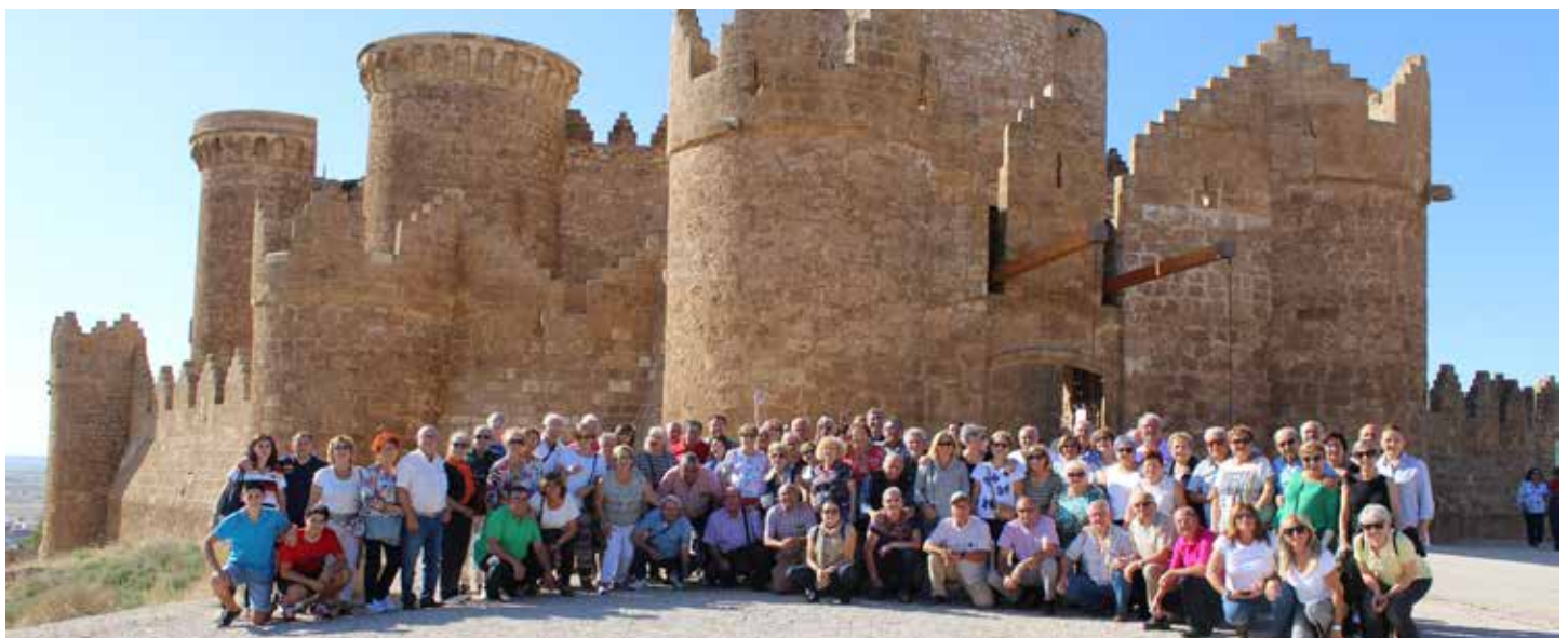
Fotografía final en el Castillo de Belmonte