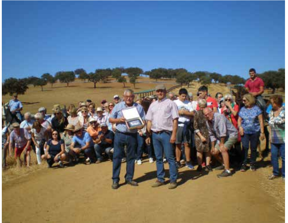
Entrega placa al mayoral de Jandilla.