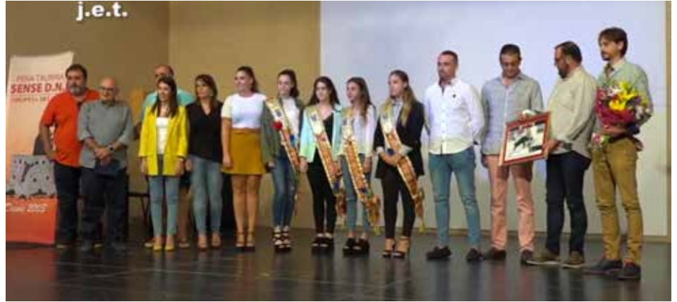
Las conferenciantes junto a miembros de la peña, autoridades, Reina de las Fiestas y Corte de Honor y los hijos del homenajeado