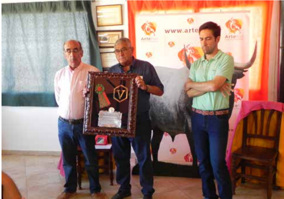
Entrega de la divisa de honor