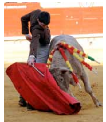
La Plaza de Castellón acogió las distintas modalidades taurinas que se celebran en la Comunidad Valenciana