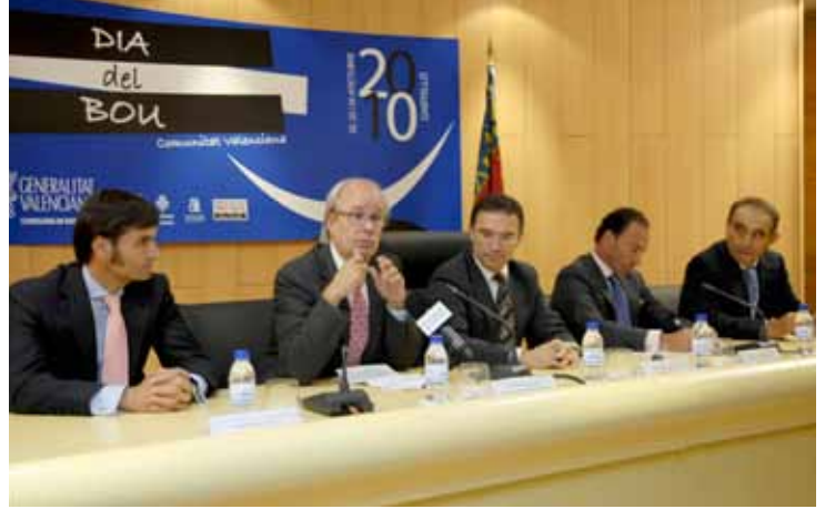
Inauguración y segunda mesa redonda

Organizado por la Consellería de Interior de la Generalitat Valenciana, tuvo lugar en Castellón, bajo el título de "Día del Bou", unas jornadas reivindicativas destinadas a ensalzar y reivindicar la importancia del toro en nuestra comunidad, abarcando todos y cada uno de los aspectos que engloba, así como las distintas modalidades que acoge nuestra tierra.